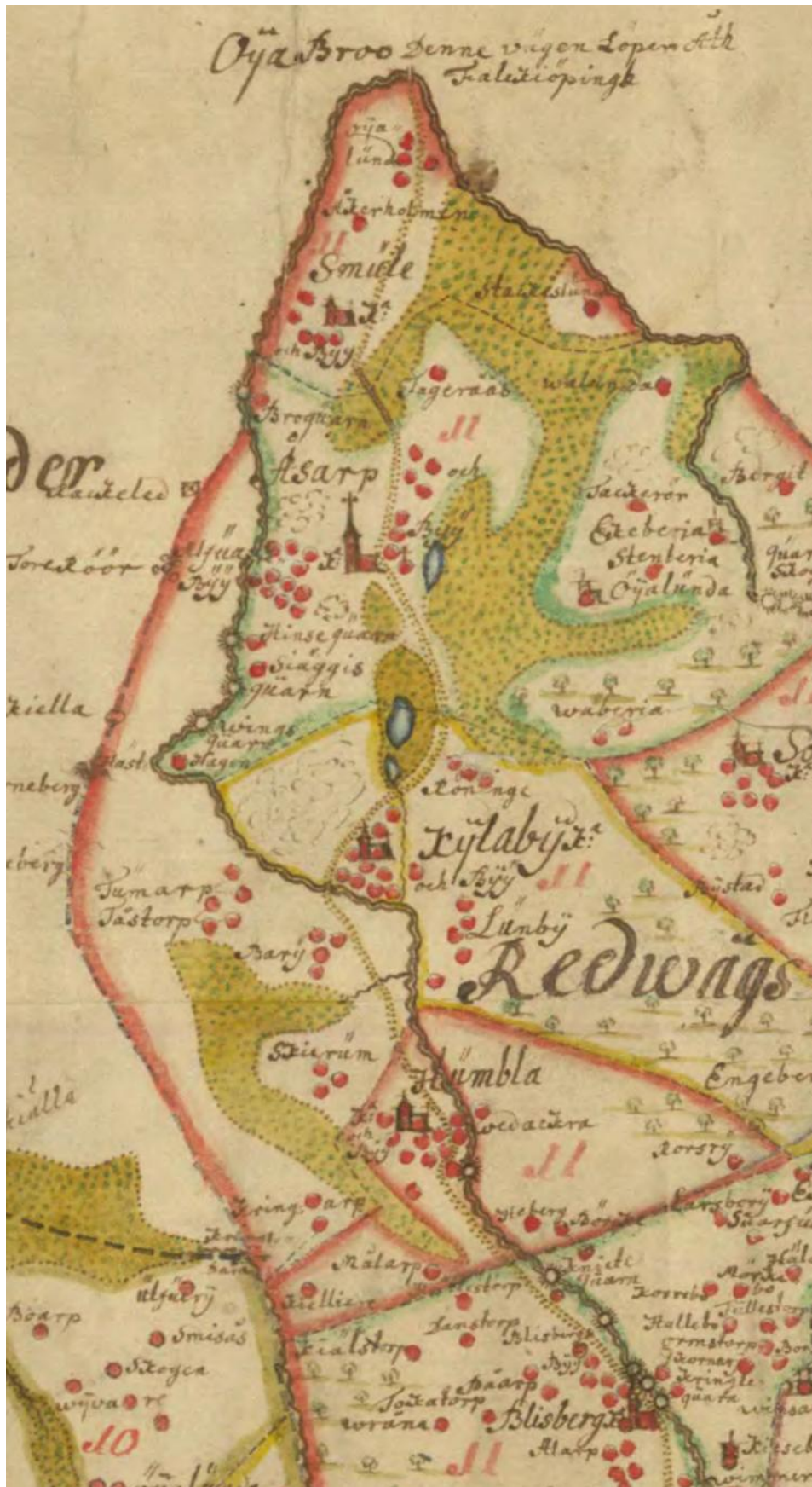
Överfarten vid Öja bro i Smula socken var den huvudsakliga bron över Ätran i denna del av Västergötland, vilket visas på kartan från 1654. Norr Om Kölaby följde inte längre vägen Ätran utan tog en annan riktning.